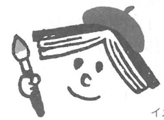
イメージキャラクター おほんちゃん